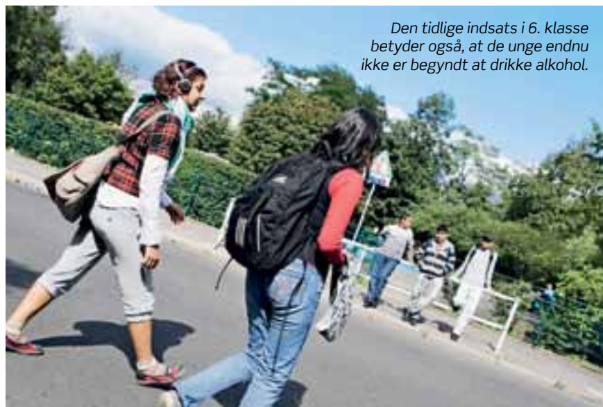
Den tidlige indsats i 6. klasse betyder også, at de unge endnu ikke er begyndt at drikke alkohol.